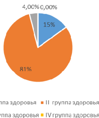
Распределение воспитанников по группам здоровья

Средний показатель пропущенных дней по болезни на одного ребёнка