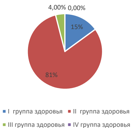
Распределение воспитанников по группам здоровья

Средний показатель пропущенных дней по болезни на одного ребёнка