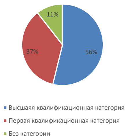
Квалификационный уровень кадров